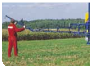
Pentajets avec antigoutte