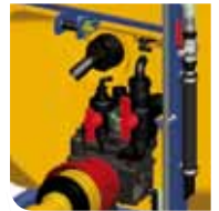
Canne d'aspiration des produits phytosanitaires