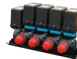
Régulateur DPM électrique avec fermetures électriques sur Demeos Z zeta et K kappa