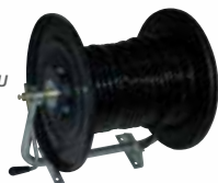
Enrouleur de tuyau

»» Enrouleur de capacité maximale de 50 m de tuyau Ø 10 mm (non fourni) avec lance fruitière