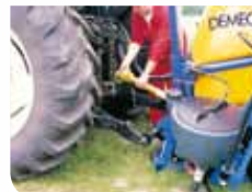
Appareil incliné vers l'arrière : attelage facilité