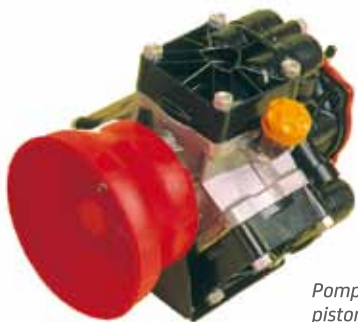
Pompe ARCA 115, 3 pistons-membranes