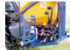
Bac d'incorporation (option) intégré au poste de mise en œuvre