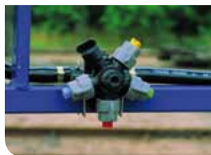
Pentajets avec antigoutte