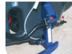
Plots élastiques de suspension