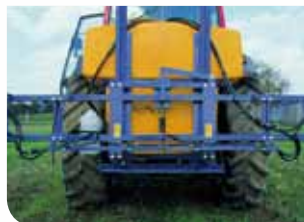
Suspension de rampe à Pivot Dynamique Souple