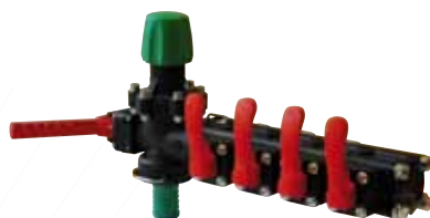
Régulateur PC avec fermetures manuelles sur Demeos β Bêta