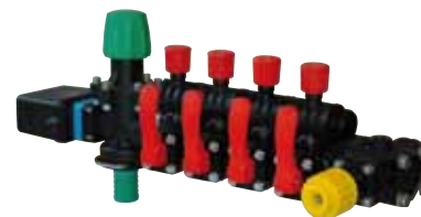
Régulateur DPM manuelle avec fermeture générale électrique sur Demeos Z zeta